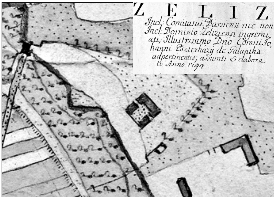
1794: dobové zobrazenie budovy ešte v tvare U – ešte ako kúria, spracovaný ručne Andreasom Zemkom

Táto kúria mala už múry z pálených tehál kombinované s kamennými blokmi. Bola to fakticky severná časť dnešného kaštieľa. V tom čase mala len tri tehlové komíny. Vo východnej časti pod budovou bola malá príručná pivnica – nachádza sa tam aj dodnes. Grófká Amália po roku 1766 začala s rozširovaním budovy kúrie. Postupne sa