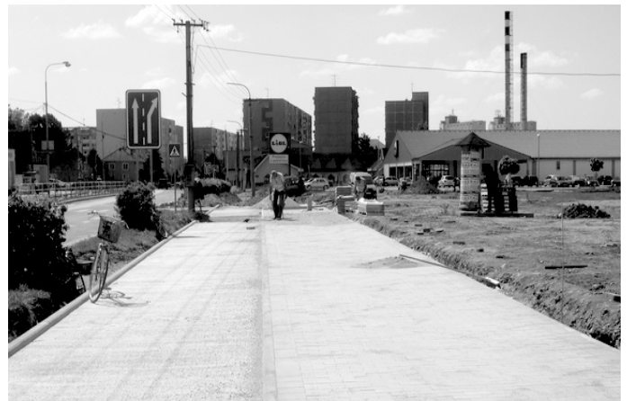
Projekt rekonštrukcie verejných priestorov pokračuje v máji budovaním cyklotrasy a chodníka na severnej strane Mierovej ulice. (šh)