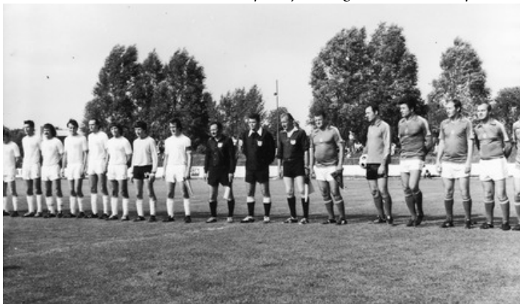
Pred priateľským zápasom so starými pánmi Maďarska, siedmy zľava