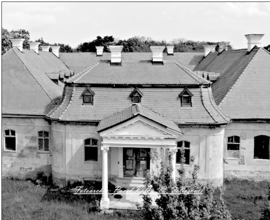
Kaštieľ v roku 2011 z vtácej perspektívy

Len pred mesiacom sa v obradnej sieni mestského úradu za účasti občanov uvažovalo o možnom spôsobe záchrany nášho kaštieľa. Budova sa, žiaľ, postupom času dostala do havarijného stavu. Pozrime sa však na jej históriu a vznik.