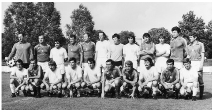
Po priateľskom zápase so starými pánmi Maďarska, siedmy zľava