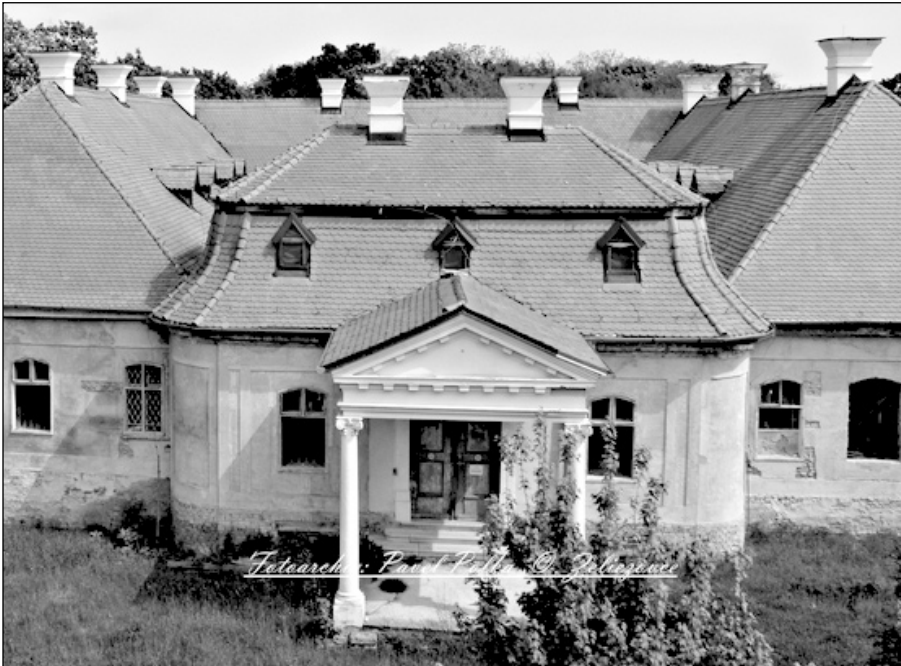
2011: a zselízi kastély madártávlatból

Alig egy hónapja a városi hivatal dísztermében együtt gondolkoztunk a jelen levő lakosokkal arról, milyen módon lehetne megmenteni a zselízi kastélyt. Az épület idővel veszélyes állapotba került. De idézzük fel a zselízi kastély történetét és létrejöttét.