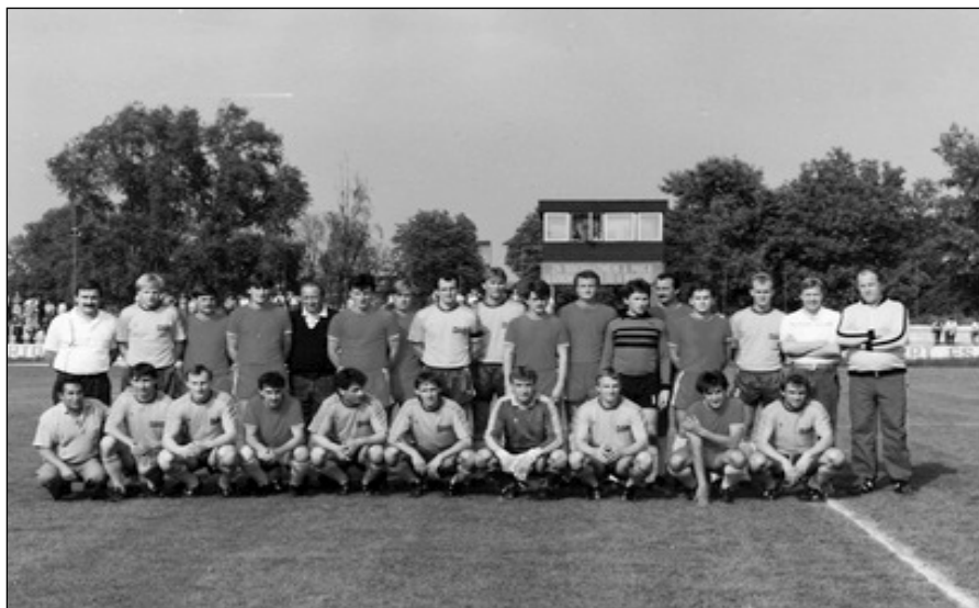
A dunaszerdahelyi DAC elleni barátságos meccs, álló sor, jobbról a hatodik