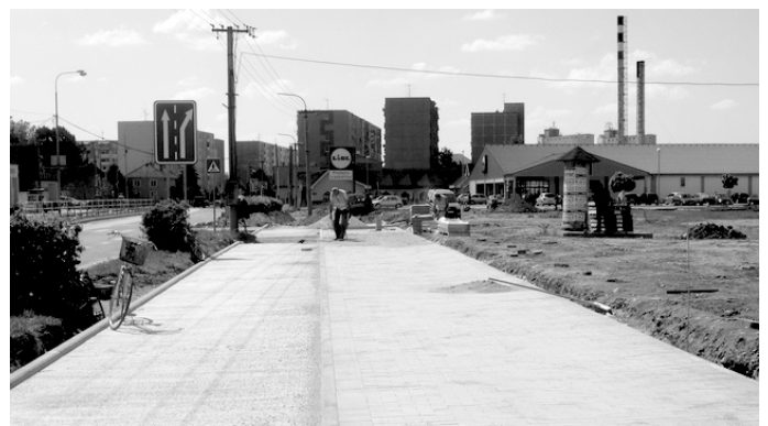
A városközpont-felújítási projekt májusban a Béke utca északi oldalának rekonstrukciójával folytatódik. (sh)