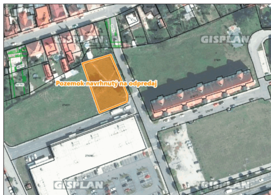
Spoločnosť ZaMED, s.r.o. požiadala o mestský pozemok za nákupným strediskom v centre mesta s cieľom vybudovania stanice Rýchlej lekárskej pomoci

Na základe uznesenia MsZ mesto vyhlasuje obchodnú verejnú súťaž na predaj pozemku s rozlohou 5223 m 2 v centre mesta na výstavbu stanice rýchlej lekárskej pomoci v reakcii na záujem spoločnosti ZaMED, s.r.o. o predmetný pozemok. Stanovená minimálna jednotková cena za pozemok v rámci OVS je 50 eur/m 2 . Schválený bol zámer na prenájom kancelárskych priestorov v budove MsÚ na ďalšie prevádzkovanie klientskeho centra Ministerstva vnútra SR z dôvodu hodného osobitného zreteľa za cenu 8,50 za m 2 za rok.