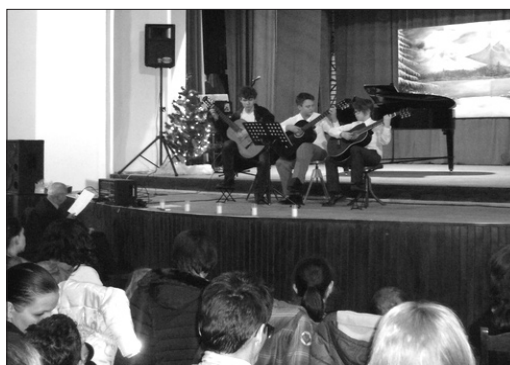
Základná umelecká škola F. Schuberta 14. decembra v Dome kultúry uviedla Vianočný koncert, v ktorom sa predviedli žiaci hudobného a tanečného odboru. Vystavené boli práce žiakov výtvarného odboru. (šh)

„V týchto lokalitách nás už poznali z televíznej súťaže Vzlietol páv, veľmi sa nám potešili a prijali nás s obrovskou láskou. Tieto účinkovania v nás zanechávajú hlboké stopy a množstvo zážitkov, aj preto tento projekt realizujeme už takmer desaťročie. Naše vystúpenia nám okrem iného poskytujú aj príležitosť spoznávať regióny, ktoré pri týchto príležitostiach navštívime. Tento rok sme navštívili pamätný park pri Stred nad Bodrogom, kde sme vysadili pamätný strom a pozreli sme si aj pamätné miesto z dôb osídlenia vlasti pri blízkej obci Karos.“ (ik)