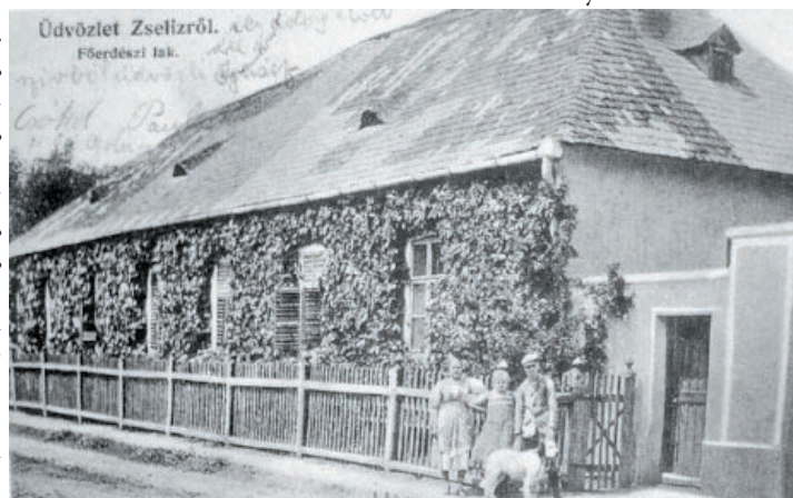
Adlerov dom, ktorý dnes slúži ako špeciálna základná škola

využívala ako byt hlavného poľného grófskych lesov. Slóvi ešte i dnes ako špeciálna ZŠ, nachádza sa