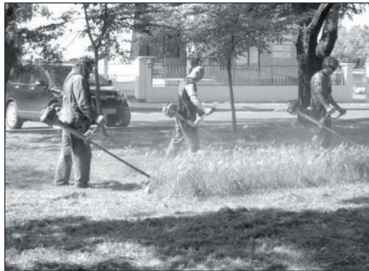
Többek közt a zöldterületek gondozása is a Vepos feladatai közé tartozik