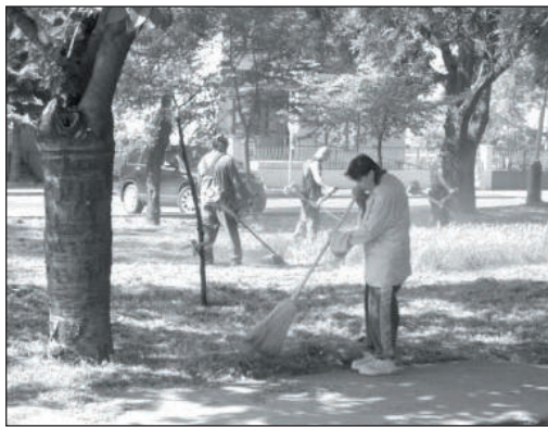
Medzi povinnosťami podniku patrí aj údržba zelene.