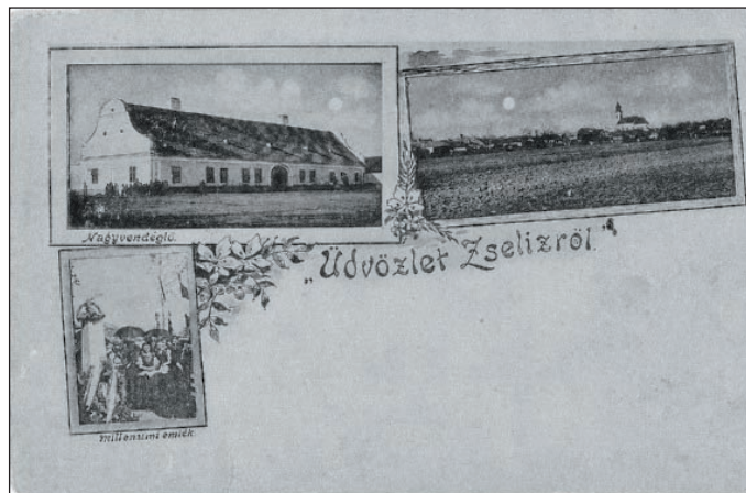
Prvá pohľadnica Želiezoviec z roku 1902

Ak vlastníte staré pohľadnice mesta či okolia, alebo fotografie zo starých čias, darujte alebo ich aspoň dajte dočasne k dispozícii autorovi týchto riadkov. Za-