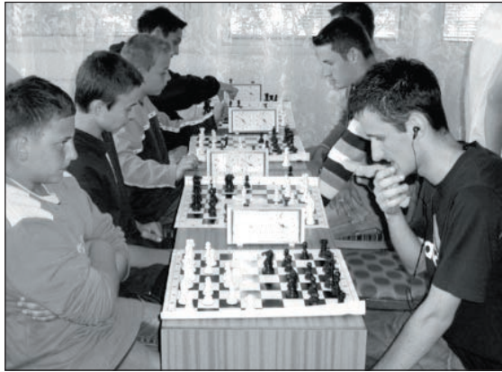
Zápolenie mies tenoraz vyhrala Trstená, ktorá zo svojich 7407 obyvateľov dokázala zapojiť 2480, čo predstavuje 33,5%-nú účasť, zo 7505 obyvateľov Želiezovciac sa zapojilo 2400, čo je 31,98%.