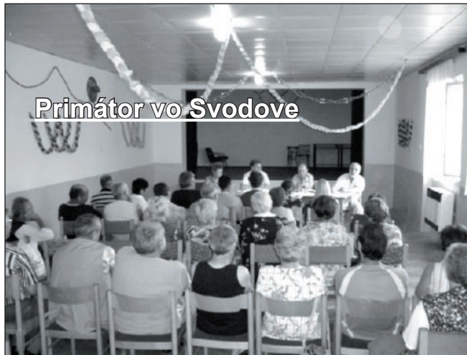
Primátor vo Svodove

- Uzavírame cyklus tvorby „hardvéru“ novej štruktúry samosprávy, čo zahŕňa novú organizačnú štruktúru, organizačný poriadok, kreovanie rád úsekov, nové pracovné náplne. Tento cyklus sa skončí tým, že zamestnanci dostanú nové pracovné zmluvy. Zamestnanci, poslanci i ja ako primátor, sme softvérom tohto procesu. Výsledkom našej práce budú koncepčné materiály, napr. rozvojový program. (ic)