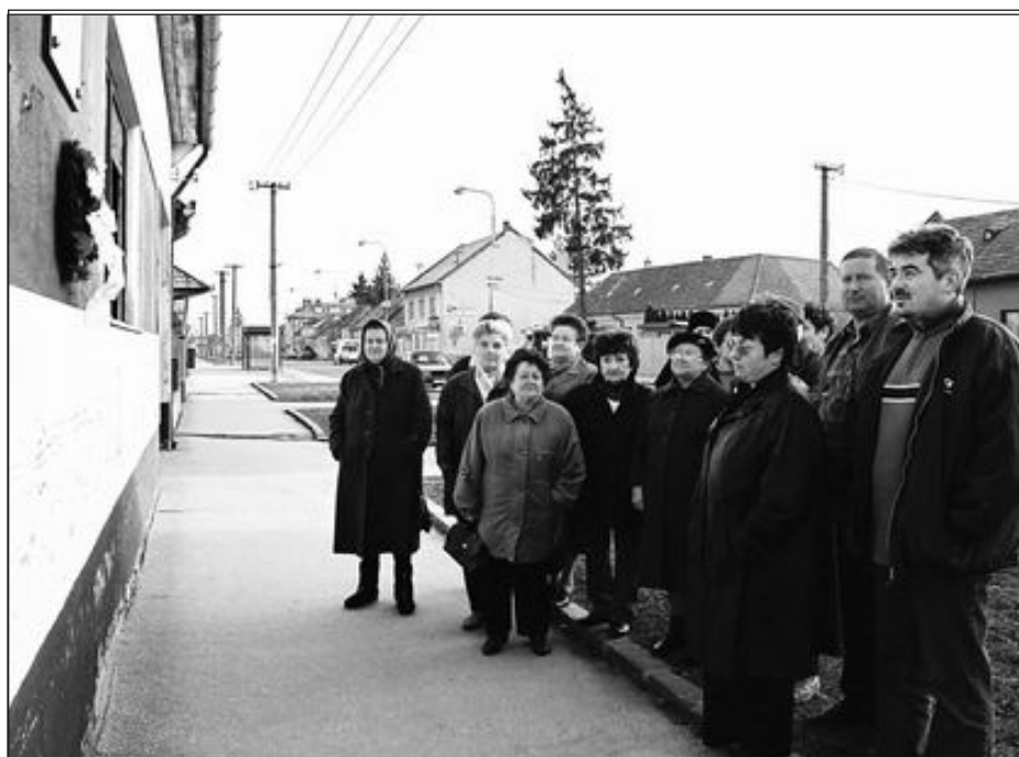
A Csemadok Zselízi Alapszervezete idén is koszorúzással emlékezett meg az 1919. március 23-án eldőrdült csendőrsortűz ártatlan áldozatairól.