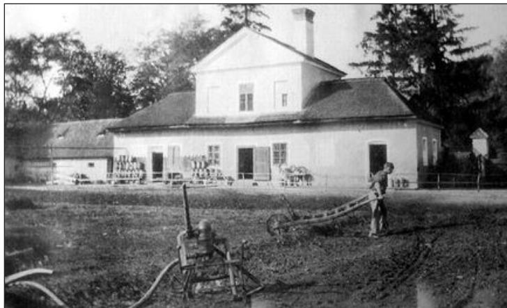
Így nézett ki a Baglyos-ház a háború előtti időszakban (hátról)

A Baglyos-házat Esterházy János Károly építtette a 19. század elején klasszicista stílusban. Ismert tény, hogy Franz Schubert