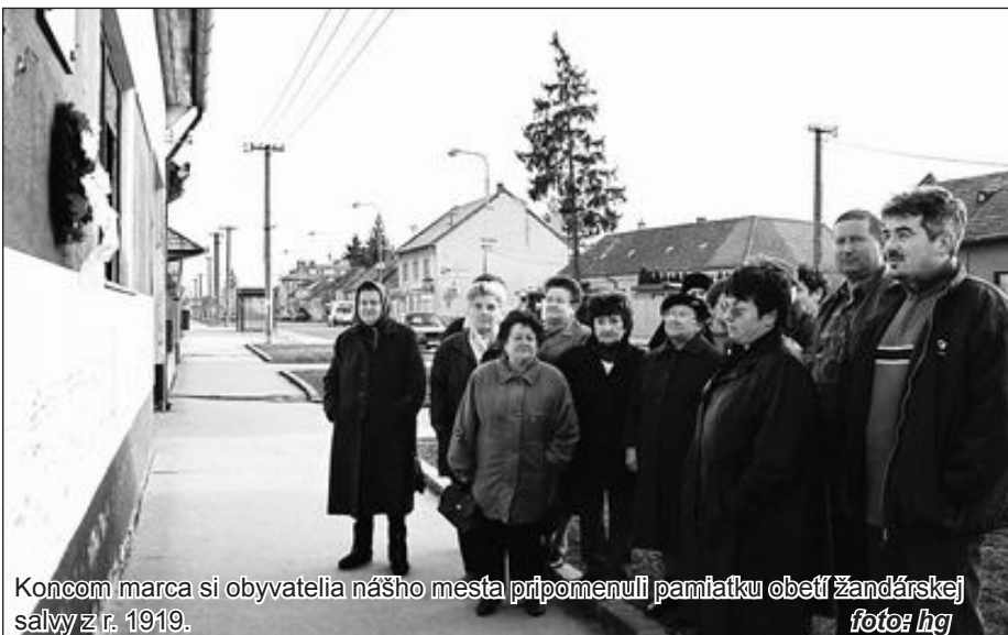
Koncom marca si obyvatelia nášho mesta pripomenuli pamiatku obetí žandárskej sály z r. 1919. foto: hg