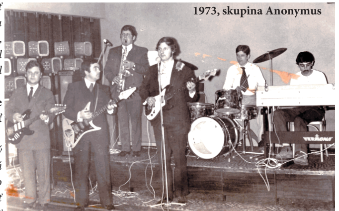
1973, skupina Anonymus

– Možno na to, na čo som aj najviac som hrdý, že počas môjho pôsobenia v Doprastave som sa podieľal na výstavbe monumentálnych diel ako vodná elektrárň v Gabčíkove či elektrárň v Šumperku. A tu v Želiezovciach, že kamkoľvek sa pozriem, všade vidím stopy mojej práce. Na každej ulici, na hlavnej ceste,