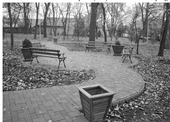
Jeden z uskutočnených projektov LEADER: park v Málaiši

Združenie sa okrem projektových aktivít prezentovalo na výstave Agrokomplex, zorganizovalo regionálnu cyklotúru, vydalo publikáciu o kultúrnom dedičstve regiónu a spolupodielalo sa na zorganizovaní putovnej výstavy historických pohľadníc a fotografií o regióne a realizovalo ďalšie aktivity. Napriek spomínanému „medziobdobiu“ bude mať množstvo úloh aj v nastávajúcich mesiacoch. „Pristúpime k vyhodnoteniu predchádzajúceho 7-ročného obdobia regiónu, počnúc od prípravy územia na prístup LEADER, cez realizáciu dovŕšených projektových kôl až po ukončenie prebiehajúcich projektov. Začneme prípravu novej rozvojovej stratégie územia 22 obcí Dolnohronského rozvojového partnerstva, s ktorou sa región bude uchádzať o podporu nových projektov v programovacom období 2014–2020.