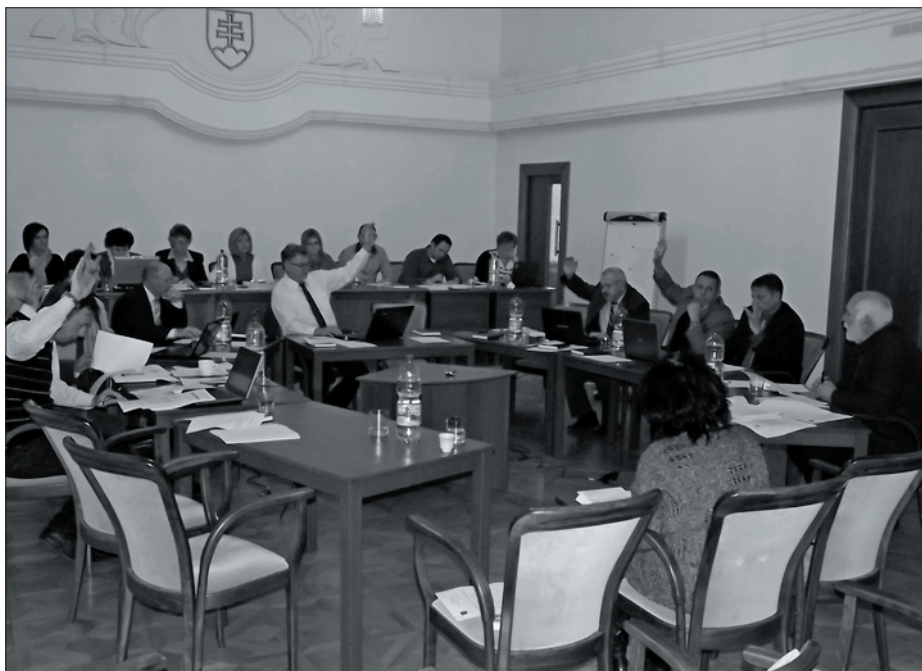
A városi képviselő-testület első idejének egyik legérdekesebb pontja a bevásárlóközpont építése iránt érdeklődő vállalatok ingatlanvásárlási kérvényeinek megtárgyalása volt. A lakásépítéssel kapcsolatos döntés a beruházó körül kialakult bizonytalanság miatt februárra marad. A testület döntött arról, hogy a város a közeljövőben néhány ingatlanját – a gondozói szolgáltatások épületében található lakásokat és a városi rendőrség épületét – eladásra kínálja fel.

Bevezetőben két, Béke utcai telekvásárlási kérvényt vitatott meg a testület. Mindkét kérvény egy-egy városközponti ingatlanfejlesztést céloz meg, amelynek eredményként egy üzletközpont épülne a Béke utcai szabad területen. Az ülésen az egyik kérvényező, a KLM Invest képviselője adta elő cége elképzeléseit. „Valójában nem is telekvásárlást kérvényezünk. A városnak előbb döntenie kellene arról, jóváhagyja-e előterjesztett beruházási tervünket. Amennyiben igen, úgy kérvényoznánk a telekvásárlást is.” Az eljárás menetét Bakonyi Pál polgármester idézte fel: „Először is meg kell változtatnunk a városrendezési tervet, majd azt követően dönthetünk a telek feleslegességéről. Minden esetben ez az eljárás, és a területrendezési terv módosítását általában a kérvényező állja.” Képviselői kérdésre az ingatlanfejlesztő társaság képviselője elmondta, hogy a város jóváhagyása esetén egy 2200 négyzetméteres üzletközpont építenének a Lidl közelében. Nem egész 1000 négyzetméteren a Tesco helyezkedne el, a fennmaradó rész bérbeadásáról a Tacco, a Deichman, a Kick Textil és tovább áruházláncok képviselőivel tárgyalnak. Az