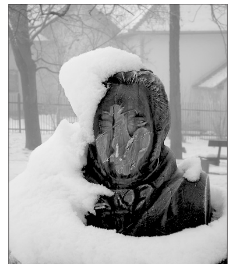
F. Schubert fából faragott mellszobrát, amelyet november közepén ismeretlen tettesek megrongáltak.