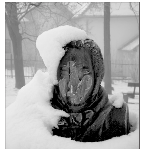
Drevorezba F. Schuberta, vystavená v parku, ktorú v polovici novembra neznámi páchatelia vážne poškodili.