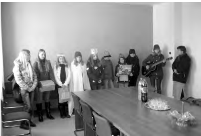
Koledníci zvestujúci Dobrú novinu zavítali aj na Mestský úrad, kde potešili zamestnancov na chodbe na prízemí i primátora mesta v zasadačke.