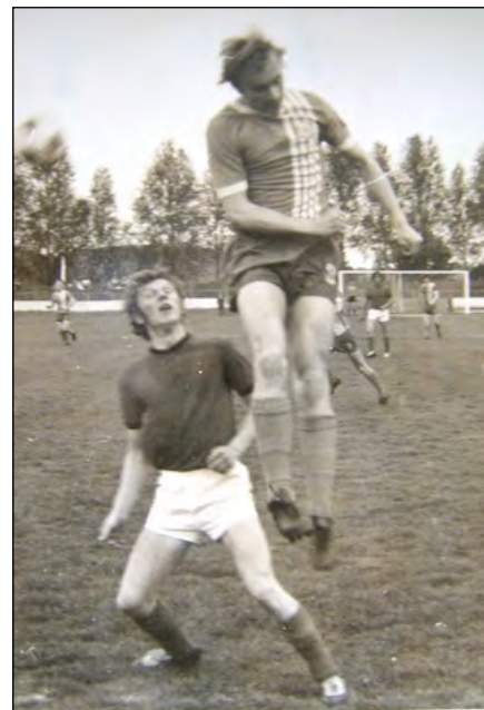
14. mája 1975: Slovan Želiezovce - Slovan Bratislava 1:7

vytrieskali 8:1, ale čestný gól som zaznamenal ja do siete reprezentačného brankára Ádáma Rothermela. Mohol som hrať proti Fenyvesimu, Páncsicovi, Vencelovi, Švehlíkovi, Mut-