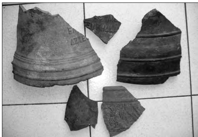
A második világháború során felrobbantott templom harangjainak darabjai.

állt. A lakosok összetartásának és segítőkészségének köszönhetően sikerült a templomot újjáépíteni. A munkák során a habarcsba sok vízre volt szükség, ezért az oldalbejárat mellett ideiglenes kutat ástak, melyet az építési munkák befejeztével betemettek. Ez az oka annak, hogy a templom déli részén növe fenyőfák egyike szebb, bujább, mint a többi. Magasabb és egészségesebb, mivel éppen a porhanyós földdel betemetett kút helyére ültették. Ugyan csak egy jelentéktelen apróságról van szó, de bizonyítékként szolgáljon a mellékelt fénykép a kútról az átépítés ide-