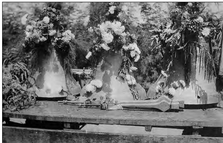
Počas I. svetovej vojny zvony odviezli do zlievarní, aby z nich urobili zbrane, ďalšie zvony zničil výbuch na konci II. svetovej vojny. Po vojne boli osadené nové, ktoré sú tam dodnes. Dúfajme, že ešte dlho...

zvony. Stačilo však len 20 rokov a Európu opäť zachvátilo vojnové besnenie. Síce počas II. svetovej vojny už zvony masovo nezaabavovali, zostali v kostolných vežiach. Ale žiaľ, práve kostolné veže boli zo strategického a prieskumného