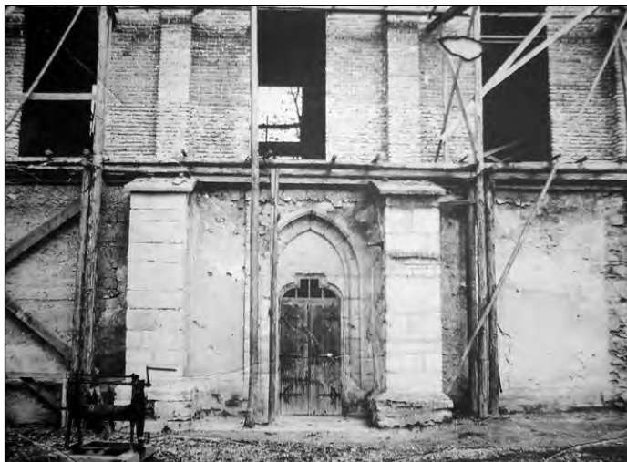
A háború után a templomot felújították. A bal oldalon látható a kút.

A templomok harangja és a déli harangszó több, mint jellegzetes III. Kallixtus pápa imabullájának 1456. június 20-i kihirdetése ill. Hunyadi Jánosnak a törökök felett aratott nándorfehérvári győzelme óta. Egy év múlva lesz már 555 éve annak, hogy ez az esemény biztosította Európának az együttélés keresztény voltát. A harangozásnak ez a módja fokozatosan teret nyert az egész világon. A jó minőségű