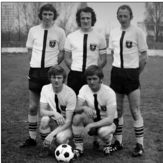
1977-ben, az első sor bal oldalán