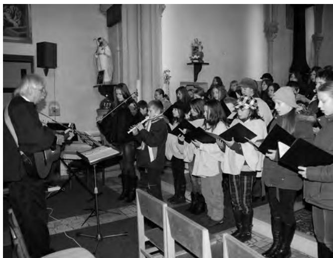
Az Alapiskola Franz Schubert Gyermekkora a hagyományokhoz híven a zselizi Szent Jakab-templomban ünnepi hangversenyyel búcsúztatta a naptári évet.