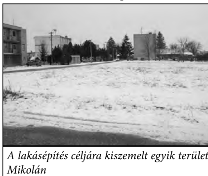
A lakásépítés céljára kiszemelt egyik terület Mikolán

igyekezetet kell kifejteni annak érdekében, hogy az előkészületi munkák mihamarább megvalósuljanak, hiszen a kérvények leadásának határideje az állami alapba március végén lesz. „A többi három lakóháztól eltérően a Kert utcai építkezésnek kissé