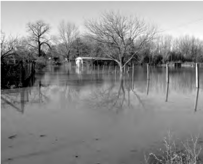
Hron nám na Štefana pripravil nezvyklú vianočnú nádielku - namiesto snežnej v podobe dramatického zvýšenia svojej hladiny. V Želiezovciach rieka zaliala záhradkársku osadu na ľavej strane cesty vedúcej do Sikenice.