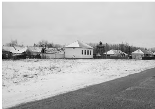
Byty by mali stáť aj v Mikuli

Bakonyi. Okrem klasického účelu rozvoja bývania v meste je možnosť vybudovať niekoľko bytov pre uspokojenie potrieb ubytovacích kapacít v súvislosti s dostavbou Atómovej elektrárne Mochovce, keďže počas výstavby 3. a 4. bloku potrebujú Slovenské elektrárne ubytovať asi 3000 pracovníkov. Časť ubytovacích kapacít by tak mohlo poskytnúť aj naše mesto. „ŠFRB poskytne na výstavbu nájomných bytov dotáciu do výšky 30 %, na zvyšných 70 % dostane mesto úver s mimoriadne výhodným úrokom 1,5 % na obdobie 20 rokov. Preferujeme