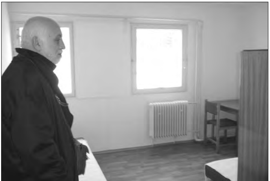
Dňa 22. decembra bola slávnostne otvorená mestská núdzová ubytovňa v Želiezovciach. Zrekonštruované priestory polovice prízemia útulku na Železničnej ulici budú slúžiť občanom mesta, ktorí sa ocitli v ťažkej životnej situácii. (Viac na 2. strane)