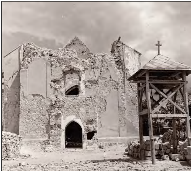
Kostol sv. Jakuba po druhej svetovej vojne

hladiska vojskami často podmiňované a ničené. Oba želiezovské kostoly postihol tento osud, 26. marca 1945 veže ležali v ruinách. Väčšie a menšie kusy bronzových zvonov ležali roztrúsené pod kameňmi a tehľami. Vraj krásne vysoké a čisté tóny zvuku katolíckych zvonov pred vojny si už matne pamätajú len tí najstarší Želiezovčania. Miestna história mi bola vždy vzácna a preto s úctou uchovávam aspoň 5 väčších a menších zachovalých kusov zo zničených zvonov želiezovského katolíckeho kostola. Po vojnových udalostiach sa postupne začal obnovovať aj kostol. Veža pred kostola sa nepostavila na mieste, kde stála stáročia, ale naboku smerom na námestie. Od spodnej časti zbúraného chrámu sa stavebné kamenivo nahradilo novými tehľami a novým stropom. Katolícke obrady sa niekoľko