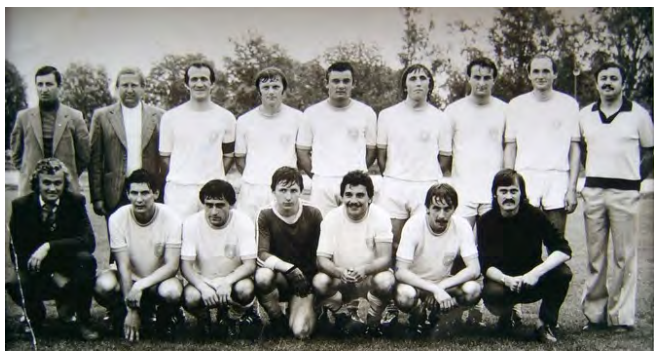
V roku 1981, štvrtý zľava v hornom rade