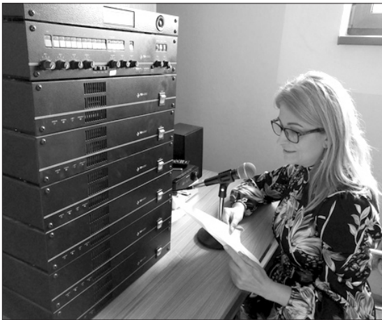
Fotó: A városi hangszóró korábban a városi hivatal informátori helyiségében üzemeltetett kezelőközpontja idén áprilistól a könyvtárban működik.

A Zselizi Városi Könyvtár jelenleg a Covid-automata minden fokozatában tudja biztosítani szolgáltatásait. „Az utóbbi időszakban két sikeres pályázatnak köszönhetően bővült könyvállományunk. Az egyik a Könyvek vándorútra mentek a Művészettámogató Alap támogatásával, a másik a Könyvpaletta a Kisebbségi Kulturális Alap támogatásával. A könyvekről