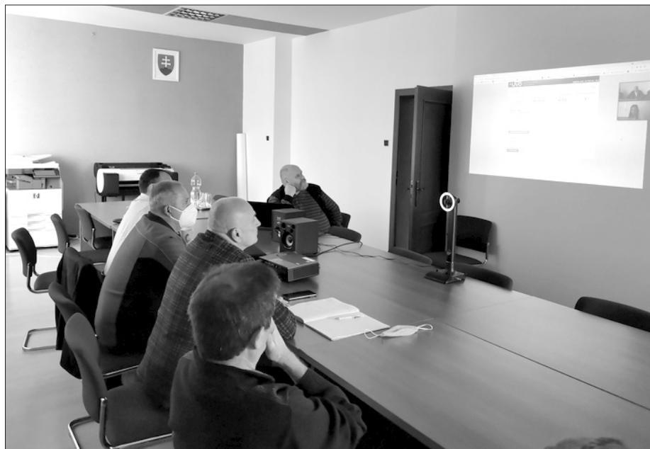
Výberová komisia mesta, zriadená pre projekt dobudovania kanalizačnej siete zasadla pred obrazovkou, aby sledovala vývoj cien elektronickej aukcie naživo. Z priebehu boli zarazení, pôvodná suma sa znížila nereálne, až o 2 milióny eur.

Vítaz verejnej súťaže však bude musieť vysvetliť, ako k takým cenám prišiel.“ To sa medzičasom aj stalo, v procese