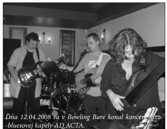
Dňa 12.04.2008 sa v Bowling Bare konal koncert jazz-bluesovej kapely AD ACTA.