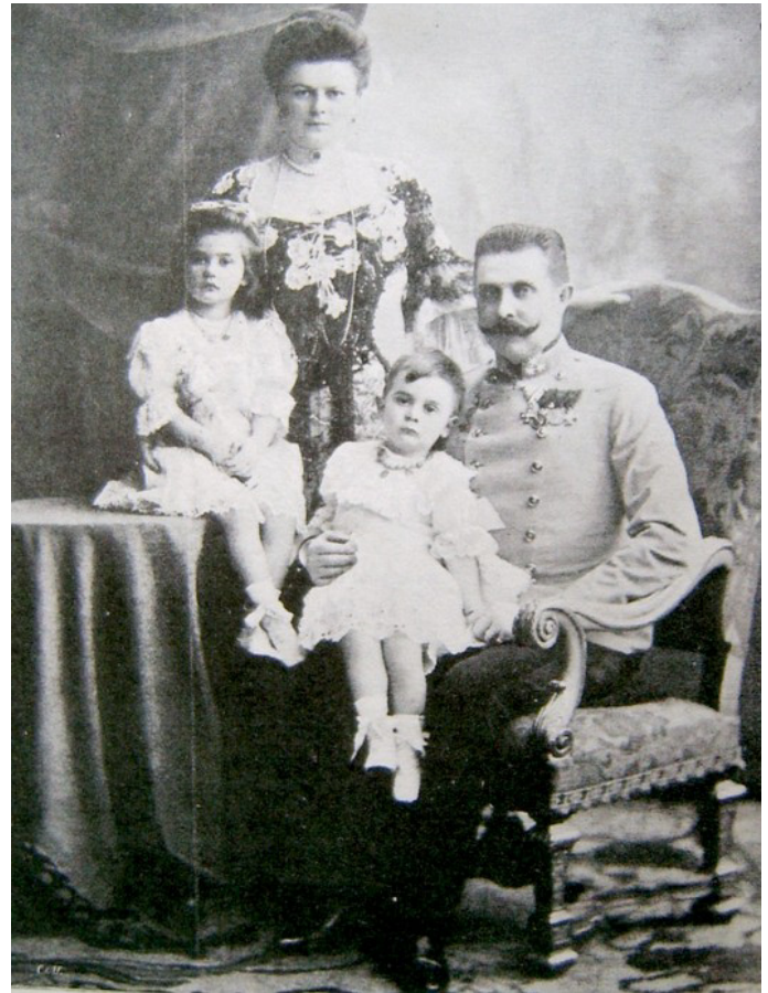
Ferenc Ferdinánd, felesége, Sophia Chotek és gyermekeik

De ezek csak találgatások. Ezen a napon Szarajevóban Gavrilo Princip diák pisztollyal elkövette a merényletet, amely ürügye volt az I. világháború kirobbanásának. A trónörökös és felesége halálos sebet kapott, és még aznap meghalt. Érdekes módon sokkal inkább halálukkal, mintsem tetteikkel írták