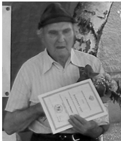
Po prevzatí ocenenia, Svodov, 22. júla 2006