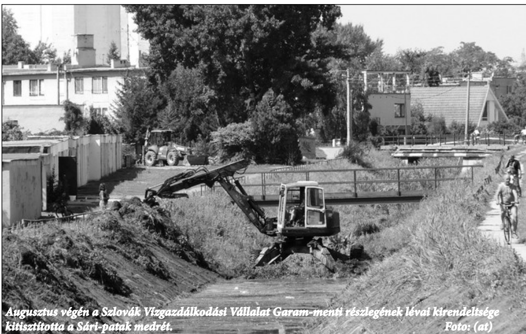
Augusztus végén a Szlovák Vízgazdálkodási Vállalat Garam-menti részlegének lévai kirendeltsége kitisztította a Sári-patak medrét.