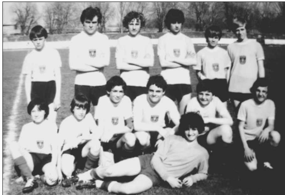
V žiackom družstve, v dolnom rade druhý sprava