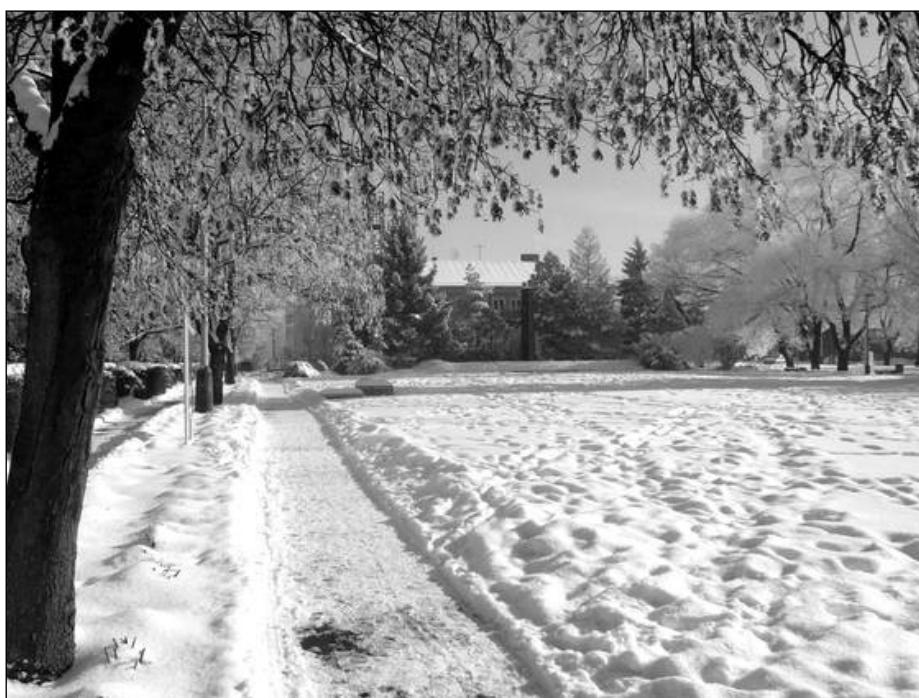
Zima nás prekvapila aj krásnymi chvíľkami.