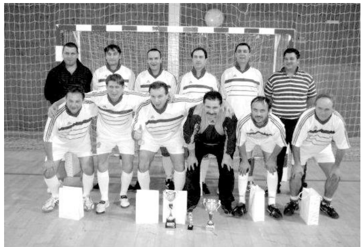
Városunk öregfiúk futballcsapata december 26-án labdarúgó tornán vett részt Léván. A 8 csapat részvételével folyó tornán a zselízieket diadalmasokdtak, miután a döntőben 2:1 arányban verték a házigazdákat.