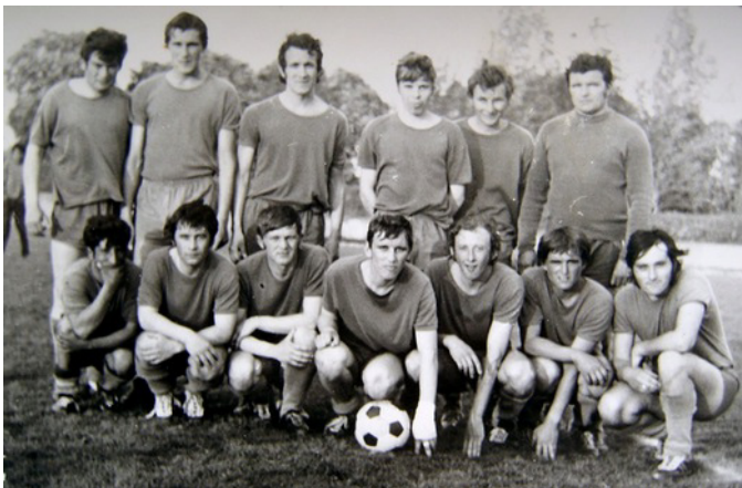
1975, Želiezovce, prvý z prava v zadnom rade