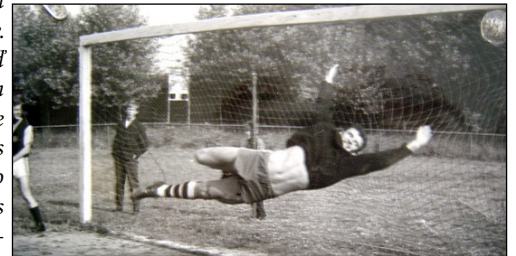
V bránke Dukly Bratislava

to dojmavo dobrý pocit, keď sa mi podarilo odvrátiť takmer isté góly. Vtedy som dokázal najviac využiť svoj rozum, keď som jed-