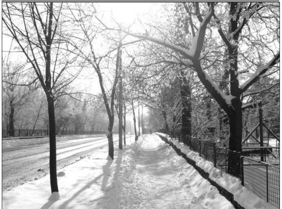
Február eleje gyönyörű téli idővel örvendeztetett meg.