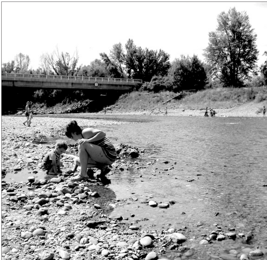
Nyári pillanatkép a Garamnál. Kisebb, mint valaha, mégis sokak számára továbbra is vonzó...