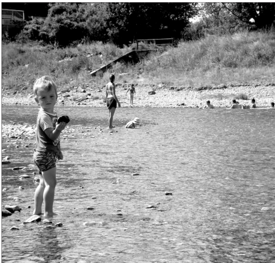
Letná momentka. Hron je síce menší, stále je však vyhľadávaný...