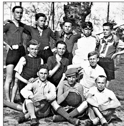
Diákcsoport a 40-es években