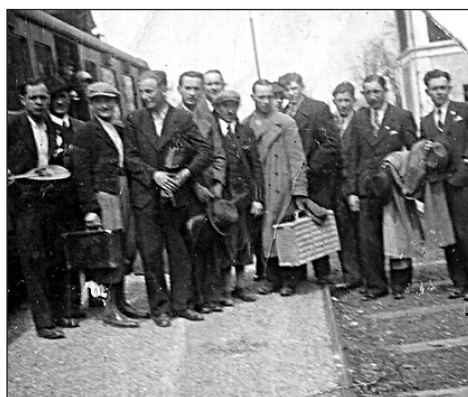
A lévai állomáson – vonattal is utazott a csapat még bajnoki mérkőzésekre is