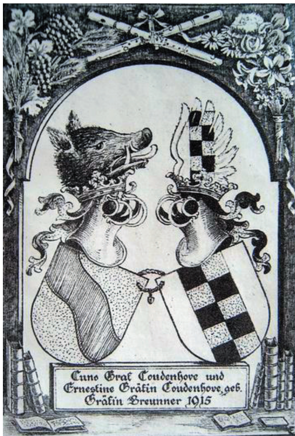
Spoločný erb rodín Coudenhove (vľavo) a Breunner (vpravo)