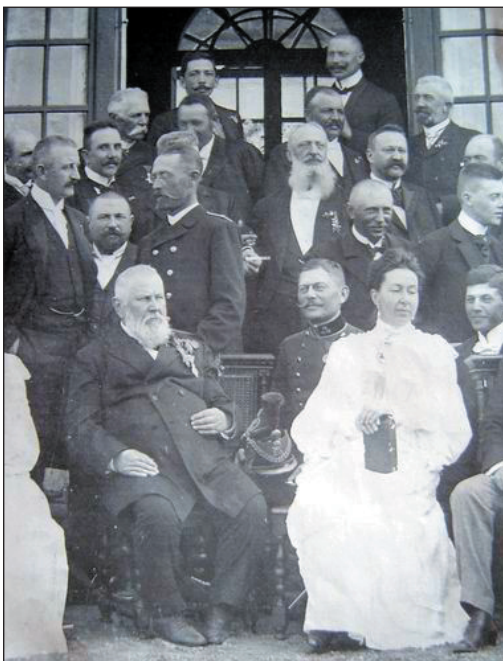
A grófnő családi és baráti körben

E cikksorozat szerzője tisztelettel kéri mindazokat, akik információval, esetleg írásos vagy fényképes dokumentációval hozzá tudnának járulni városunk történelmének feltáráshoz, hogy jelentkezzenek a 0905 77 06 55-ös telefonszámon.