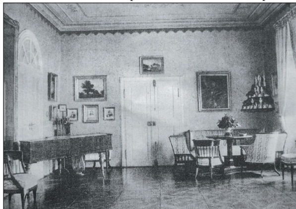
Severná sála kaštiela, kde bol klavír umiestnený dlhé desaťročia, kým nezmizol. Existujú podozrenia, kde môže byť teraz.

Želiezovce majú mimoriadne bohatú históriu. Spomeniem azda jednu z najvýznamnejších osôb, ktoré žili v našom meste. Vlni sa mi dostal do rúk originál listu z kaštiela v Želiezovciach. Súvisel práve so Schubertom.